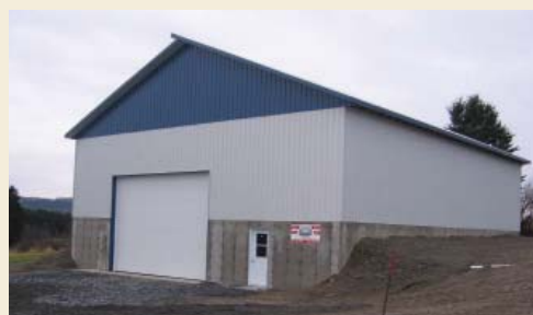
Nouvel entrepôt à litière

Les propriétaires de l'entreprise, Cathy Quinaux et Steve Plante, caressaient le projet de doubler leur production de poulets à griller depuis un bon moment. Ils y ont cru et ils ont finalement réalisé leur projet. Lors des portes ouvertes, le 25 septembre dernier, plusieurs personnes se sont déplacées pour visiter le nouveau bâtiment de 150 pi x 40 pi sur deux planchers. Ils en ont également profité pour construire un entrepôt à litière.